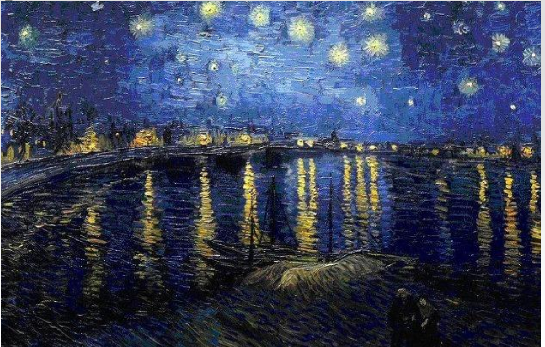
별이 빛나는 밤에-고흐