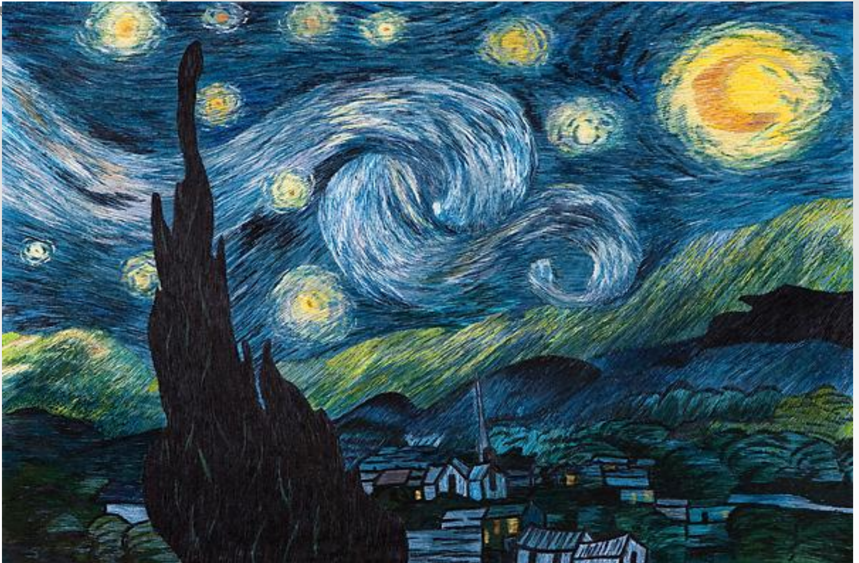
별이 빛나는 밤에-고흐